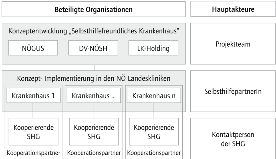
Abbildung 1: Projektstruktur