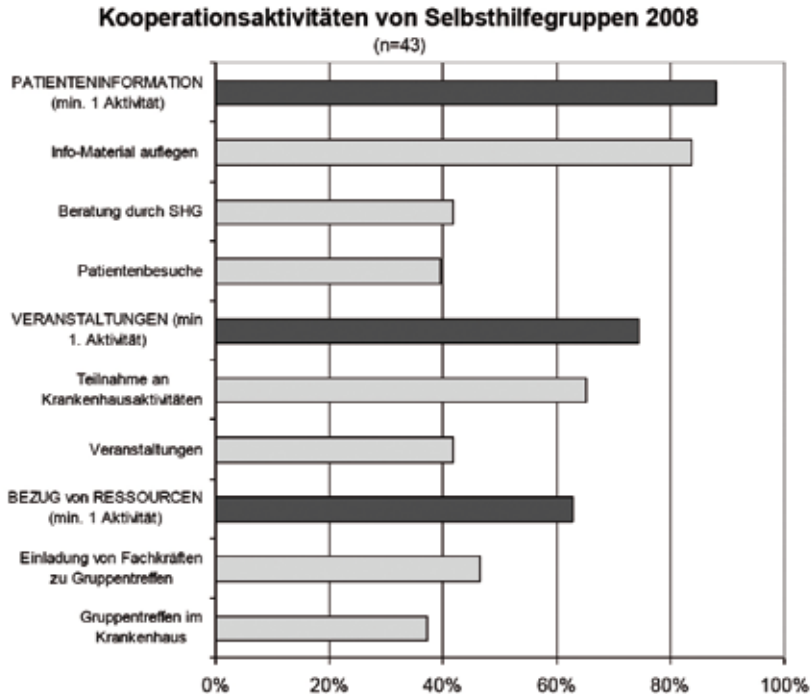
Abbildung 2: Aktivitäten von Selbsthilfegruppen im Krankenhaus 2008